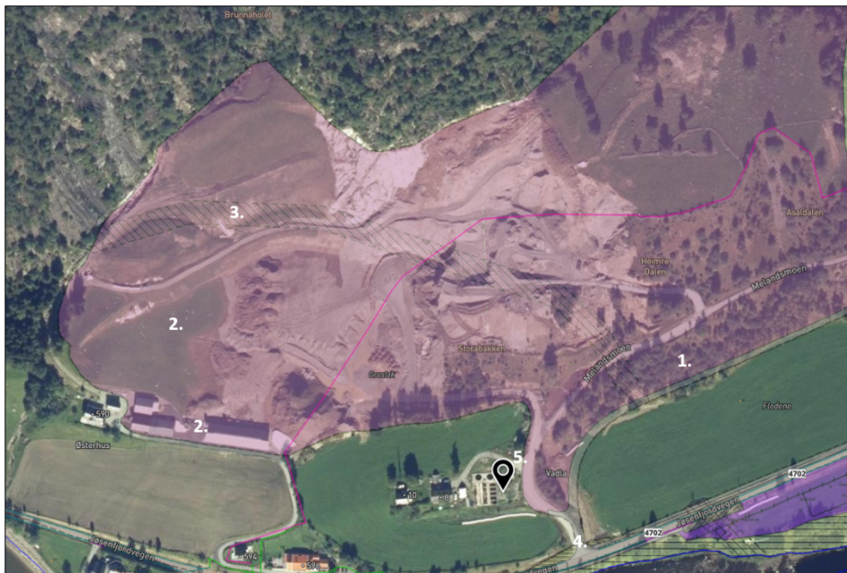
Figur 2. Ortofoto i bakgrunnen og delene som av plan R124 som varsles endret.

Det legges også opp til følgende endringer: