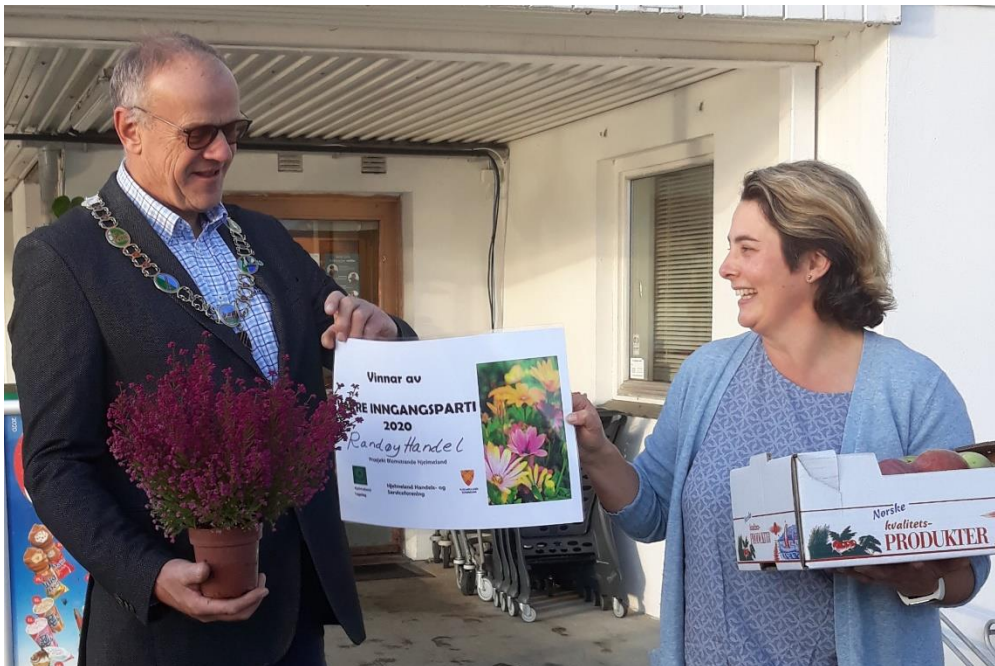
Randøy handel vart vinnar av «Vakre inngangsparti» 2020 – eit samarbeid mellom hagelag, handel og serviceforening og kommune.