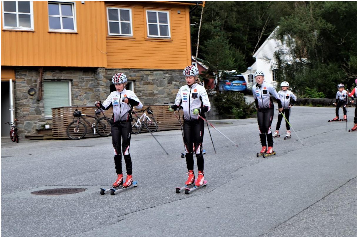
Rulleskiløype står på ønskelista til den aktive skigruppa i Hjelmeland IL. Frå Ringfest 2019.