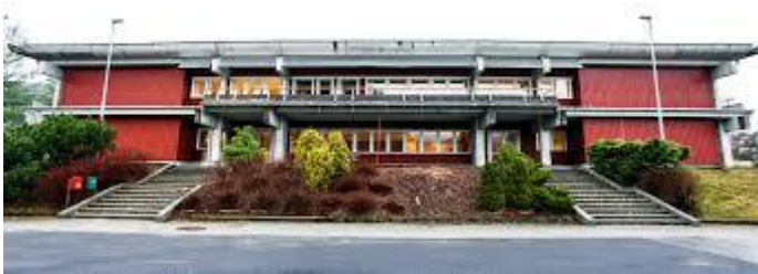
Hjelmeland ungdomsskule – opna i august 1973

For Hjelmeland er det to spørsmål som dei siste tiåra har dukka opp med ujamne mellomrom i ulike variantar; struktur innan skule og omsorg. I dag har me ein felles, noko nedslitt ungdomsskule, og tre barneskular. Og så har me to omsorgssenter. I denne perioden ønskjer kommunestyret å arbeida med fornying av ungdomsskulen utan å sjå på struktur inna oppvekst. Innafor omsorg vil ein ha ei sak i fyrste halvdel av 2021.